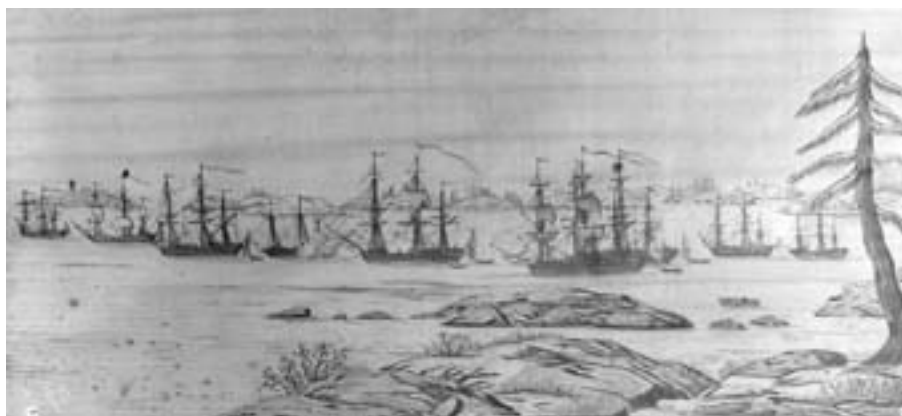
Venäläinen eskaaderi Hangossa 1788. Koruommel mustalla langalla valkoiselle silkille.

Vuonna 1714 oli Tvärminnen edustalla taas venäläinen kaleerilaivasto, jonka ruotsalainen valvontalaivue oli torjunut Hangon Tullin edustalla. Tällä kertaa se onnistui olemaan ruotsalaisia ovelampi. Ruotsalaiset olivat tyynessä hinanneet hitaat linjalaivat ulos kohti Russarötä. Koska redi oli tyhjennetty raskaasta tykistöä, pyyhkäisivät soutualukset rantavedessä niemenkärjen ohi. Näin oli Suomi ja Ahvenanmaa auttamattomasti menetetyt. Tapahtumat toistuivat 1743. Vuonna 1747 Augustin Ehrensvärd oli kiinnostunut Hangosta, joka oli hänen mielestään tärkeä kohta ja syytä varustaa pattereilla. Hangon sataman edusta, joka oli väylien leikkauskohta, oli elintärkeä ja siksi sen ympärillä olevat kalliot piti varustaa tykistöpattereilla. Ehrensvärd iski silmänsä Eldskäriin, myöhempään Gustafsvärniin eli Kustaanvarustukseen sijoittaakseen sinne mahdollisimman matalalle tykistöpatterin, joka kykenisi ampumaan veden pinnassa. Suomessa kuitenkin kilpailu varoista ja työvoimasta oli aivan liian kova, jotta Hangolla olisi ollut mahdollisuuksia.