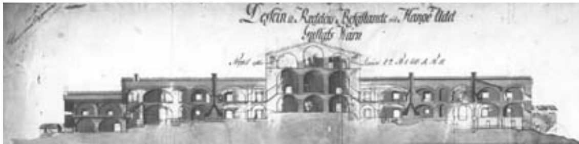
Poikkileikkaus Kustaanvarustuksen linnoituksesta katsottuna vasemmalta.

Todennäköisesti Hanko on ammoisista ajoista lähtien ollut sekä satamapaikka että puolustukselle tärkeä paikka. Kun Ruotsin armeija oli tuhottu Pultavan luona 1709 olivat tiet Suomeen auki. Suomen valloituksen aikana oli yksi toivo jäljellä – Hanko. Raskailla linjalaivoilla onnistuttiin Hangon niemen tärkeä asema pitämään hallussa muutaman kesäkauden ajan.